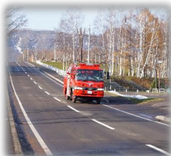
広報訓練 (広報車による広報)