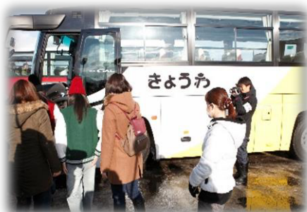
住民避難訓練 (バスによる避難)

※ 2 月 5 日（月）に、防災関係機関によるオフサイトセンター運営訓練などを実施します。