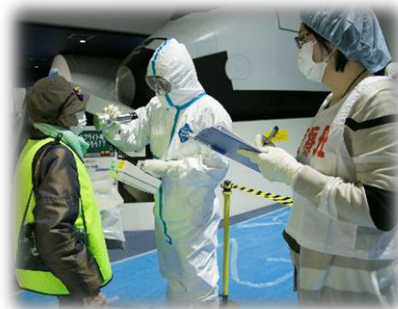
原子力災害医療活動訓練 (避難退域時検査)