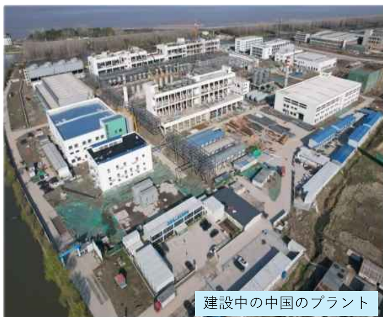
建設中の中国のプラント