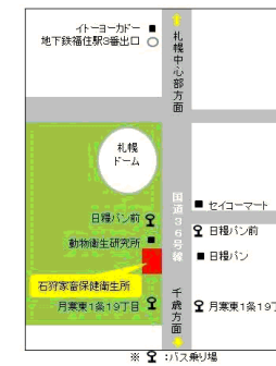
石狩家畜保健衛生所周辺配置図