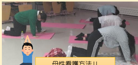
母性看護方法II 更年期に効くヨガ体験