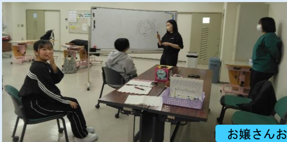
お嬢さんお絵かきですよ！

1年生は、冬休み明けすぐに基礎実習があり、その後も講義日程や試験が立て込み、毎日真剣に取り組んでいます。実習では緊張しながらも多くの学びがありました。ホームルームでは、クラス目標の達成状況や課題など話し合っていますが、2月6日のホームルームでは、久しぶりにクラスレクを行いました。内容は“奥様お絵かきですよ”をもじって「お嬢さんお絵かきですよ！」です。絵心のある人もそうでない人も発想の転換で相手に伝える様子は、非言語的コミュニケーションに役立っているなあと感じています。久しぶりにみんなで笑い合いました！因みに右は実習場での行動調整、左は怒っている私…らしいです☺ 《1学年担当：金田いづみ》