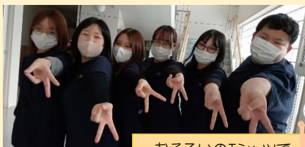
おそろいのTシャツで ミニバレー参戦