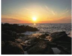
留萌振興局(留萌市)「黄金岬」