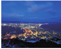
渡島総合振興局(函館市)「函館山」