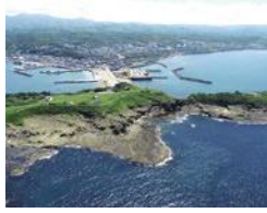
檜山振興局(江差町)「かもめ島」