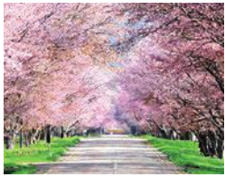
日高振興局(浦河町)「優駿さくらロード」

全道27カ所の勤務地があり、様々な地域で農業 農村整備に携わるので、各地域の食・自然・文化 などに触れることができます。