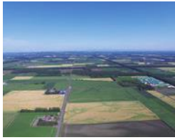
十勝総合振興局(帯広市) 「十勝平野」