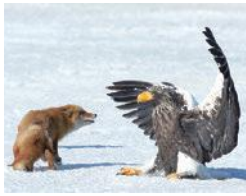
根室振興局(根室市)「風蓮湖の野鳥」