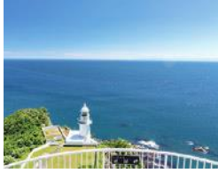
胆振総合振興局(室蘭市)「地球岬」