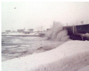
朱文別海岸（増毛町）の越波状況