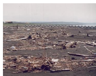
流木の漂着 (遠別町)