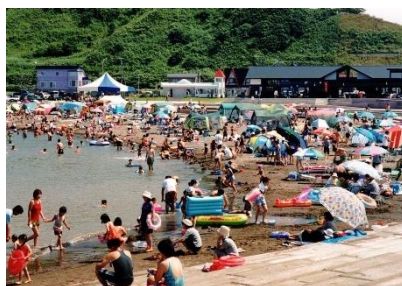
鬼鹿ツインビーチ