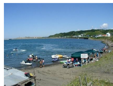
水上オートバイ利用状況