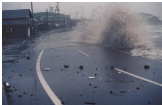
仙法志漁港海岸越波状況（利尻町）