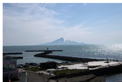
ノシャップ岬から 秀峰利尻富士を望む