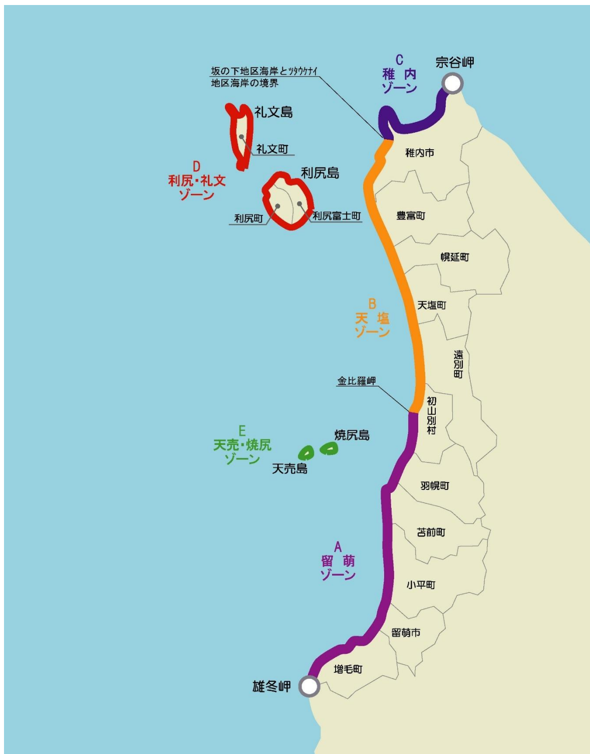
図- 3.1 ゾーン区分図

地域の特性に応じ、バランスのとれた計画を策定し海岸の保全を進めていくために、ゾーン区分を行い、各ゾーンにおける方向性を示す。