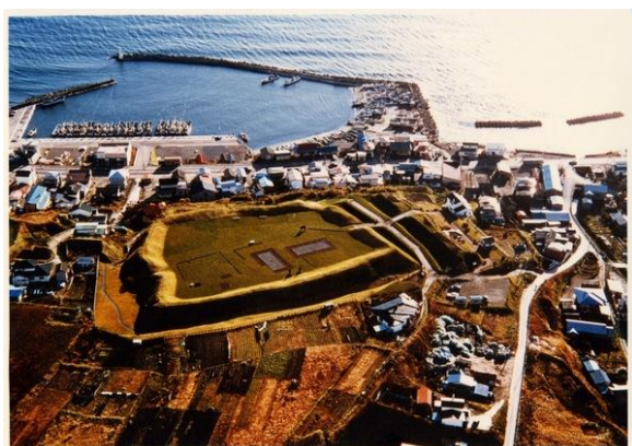
写真－22 史跡 志苔館跡(函館市志海苔町)