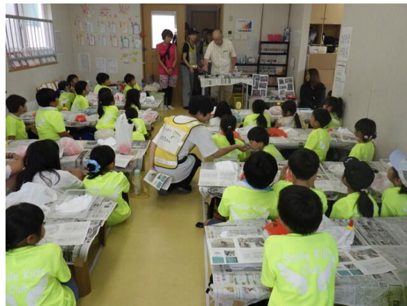
写真 - 21 海岸の環境学習