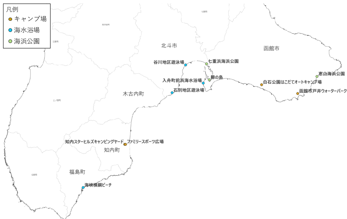
図 - 24 渡島沿岸の主な海水浴場、海浜公園、キャンプ場

◆北海道の夏は短く、海水浴場や海浜公園、海辺のキャンプ場などの利用施設はその短い夏を満喫しようと大勢の人々で賑わいます。利用者からは安全できれいな利用施設が求められており、ゴミ・水質の管理、砂浜の侵食対策、事故防止の啓発など総合的な管理・整備が必要となります。