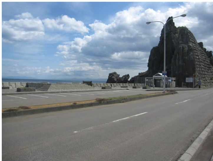
写真-25 イカリカイ駐車公園(知内町)