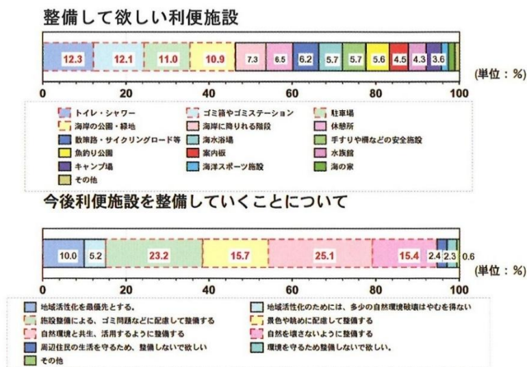
図-25 整備して欲しい便利施設、便利施設の整備について

◆渡島南沿岸住民アンケートによると、「整備して欲しい便利施設は」ではトイレ・シャワー、ゴミ箱やゴミステーション、駐車場、海岸の公園・緑地が多く、「便利施設の整備」では、自然環境と共生・活用、ゴミ問題に配慮、景色や眺めに配慮するという意見が多くなっています。自然環境・景観に配慮した利用施設を整備し、人々が安全に浜辺とふれあい、同時に海辺の自然環境を学ぶことのできる空間を提供していくことが重要です。