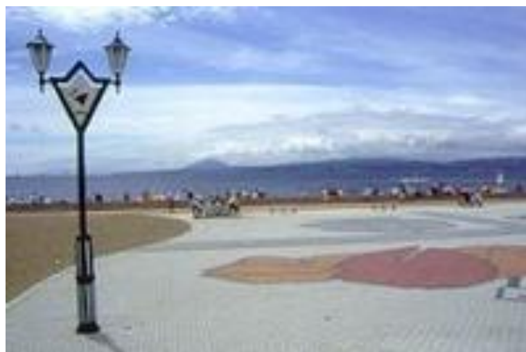
写真 - 24 七重浜海浜公園