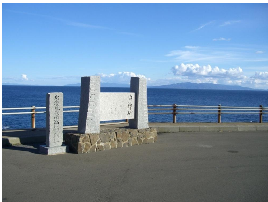
写真 - 27 松前町 白神岬