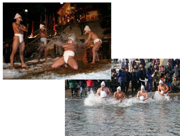
写真－23 寒中みそぎ祭り(木古内町)