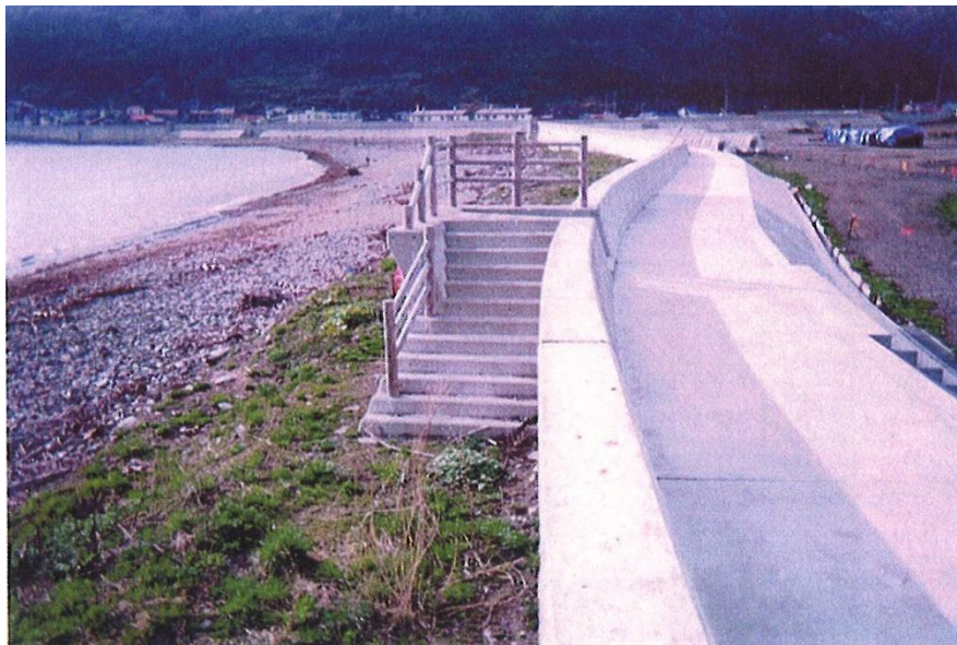
写真 - 26 護岸から砂浜への階段