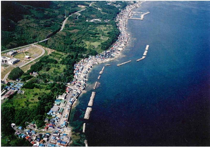
写真- 17 空から見た南茅部海岸