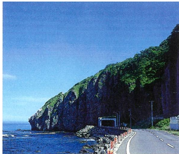
写真- 19 木直獅子鼻岬