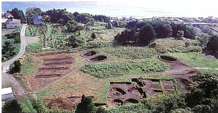
写真- 20 大船C遺跡