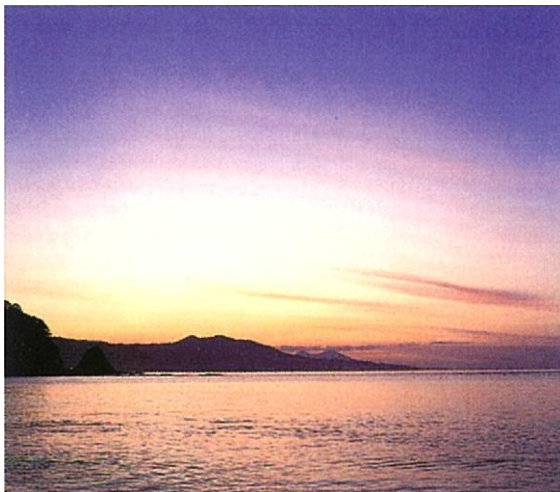
写真- 18 黒鷲岬