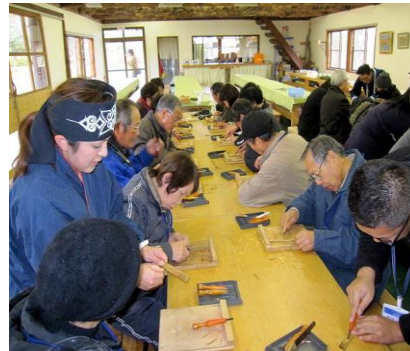
②アイヌ高齢者のコミュニティ活動への支援