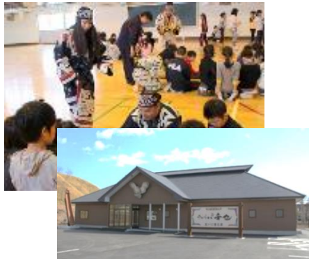
①アイヌの人々と地域住民交流の場の整備 (多機能型交流施設の整備)