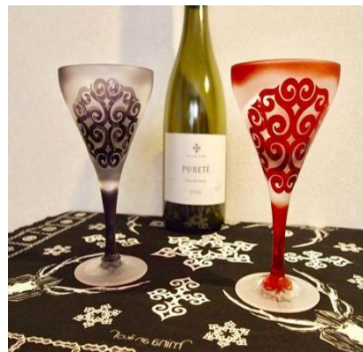
⑥アイヌ文化のブランド化推進 (デザイナーとのコラボ)