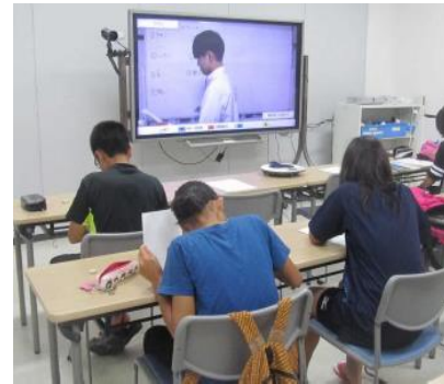
③アイヌ文化等を担う人材育成のための子どもの学習支援