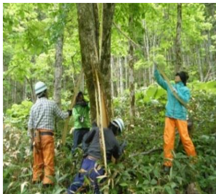
⑤木工芸品等の材料供給システムの整備