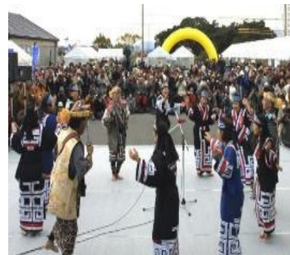
⑦アイヌ文化関連の観光プロモーションの実施