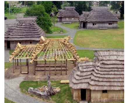
④伝統的なアイヌ文化・生活の場の再生支援