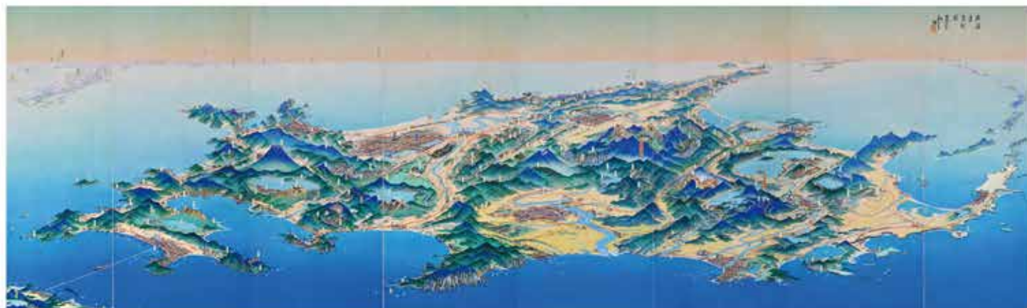
「北海道鳥瞰図」1936(昭和11)年、北海道博物館所蔵(収蔵番号041915)

船が集まる小樽の街に、青くそびえる羊蹄山・・・大正から昭和中頃にかけて全国的に活躍した商業美術家・吉田初三郎(1884-1955)は、見どころ盛りだくさんの北海道の姿を描きました。完成から90周年を迎えた大作「北海道鳥瞰図」「北海道十景」が一堂に会するほか、人びとの手元で親しまれた観光案内や絵葉書も紹介。かつての北海道をめぐる旅へ出かけましょう。