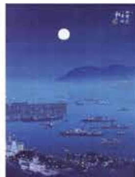
「北海道十景」(10枚組) 1936(昭和11)年、北海道博物館所蔵(収蔵番号041916)。左から「地球岬雪吹風」「阿寒湖の藍色」「大雪山と旭橋」「層雲峡銀河之瀧」「小樽港之月明」