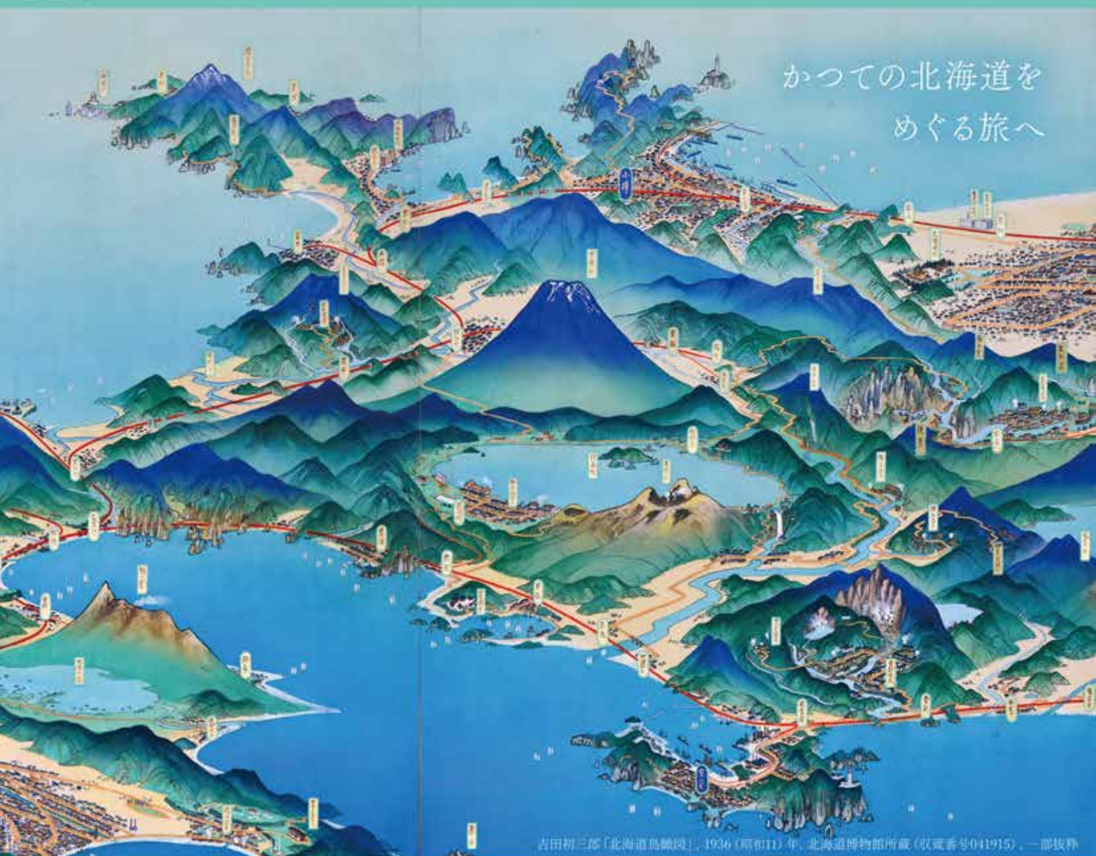
吉田初三郎「北海道鳥瞰図」, 1936 (昭和11) 年, 北海道博物館所蔵 (収蔵番号041915)。一部抜粋