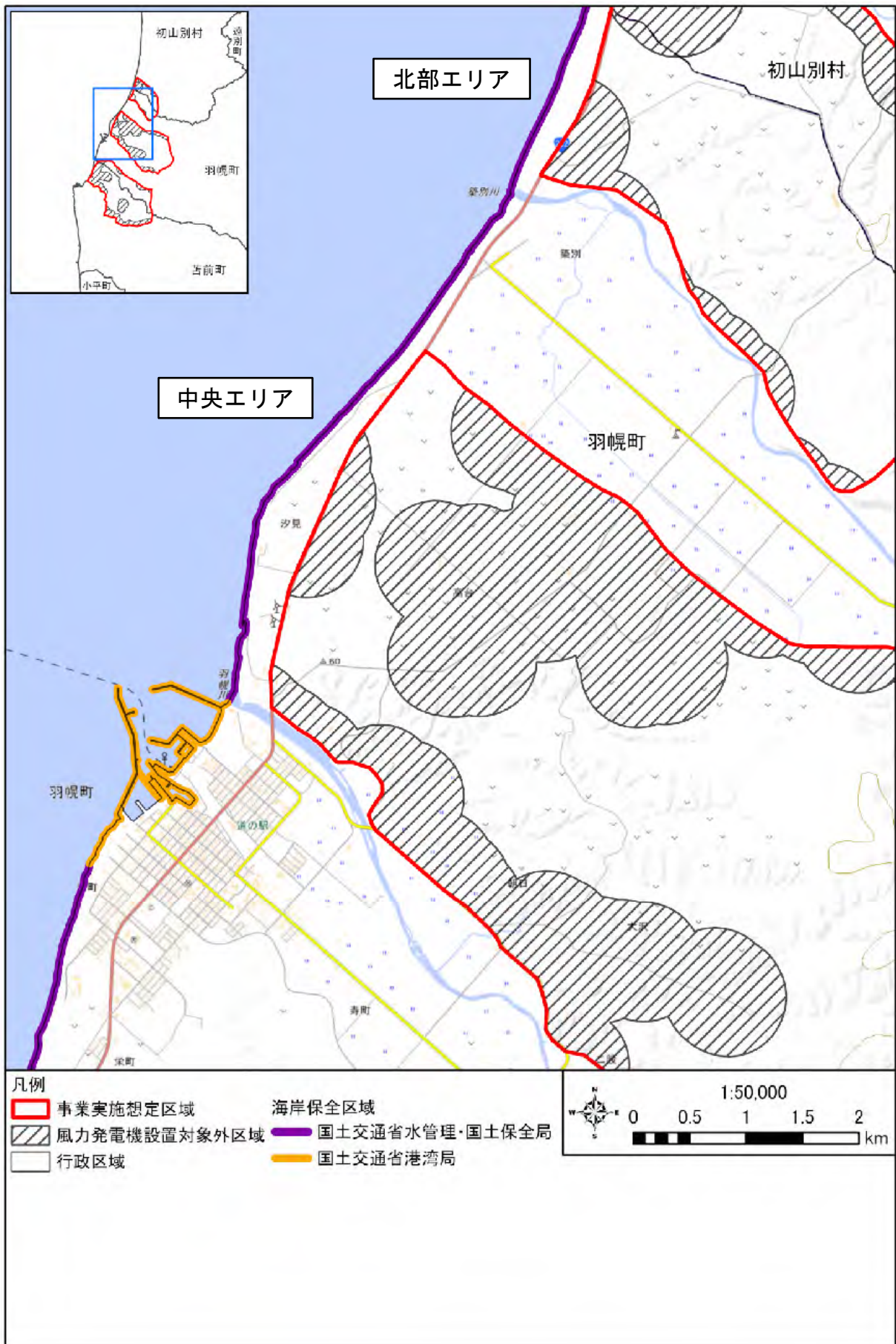
図 海岸保全区域の分布状況(詳細)(3/4)