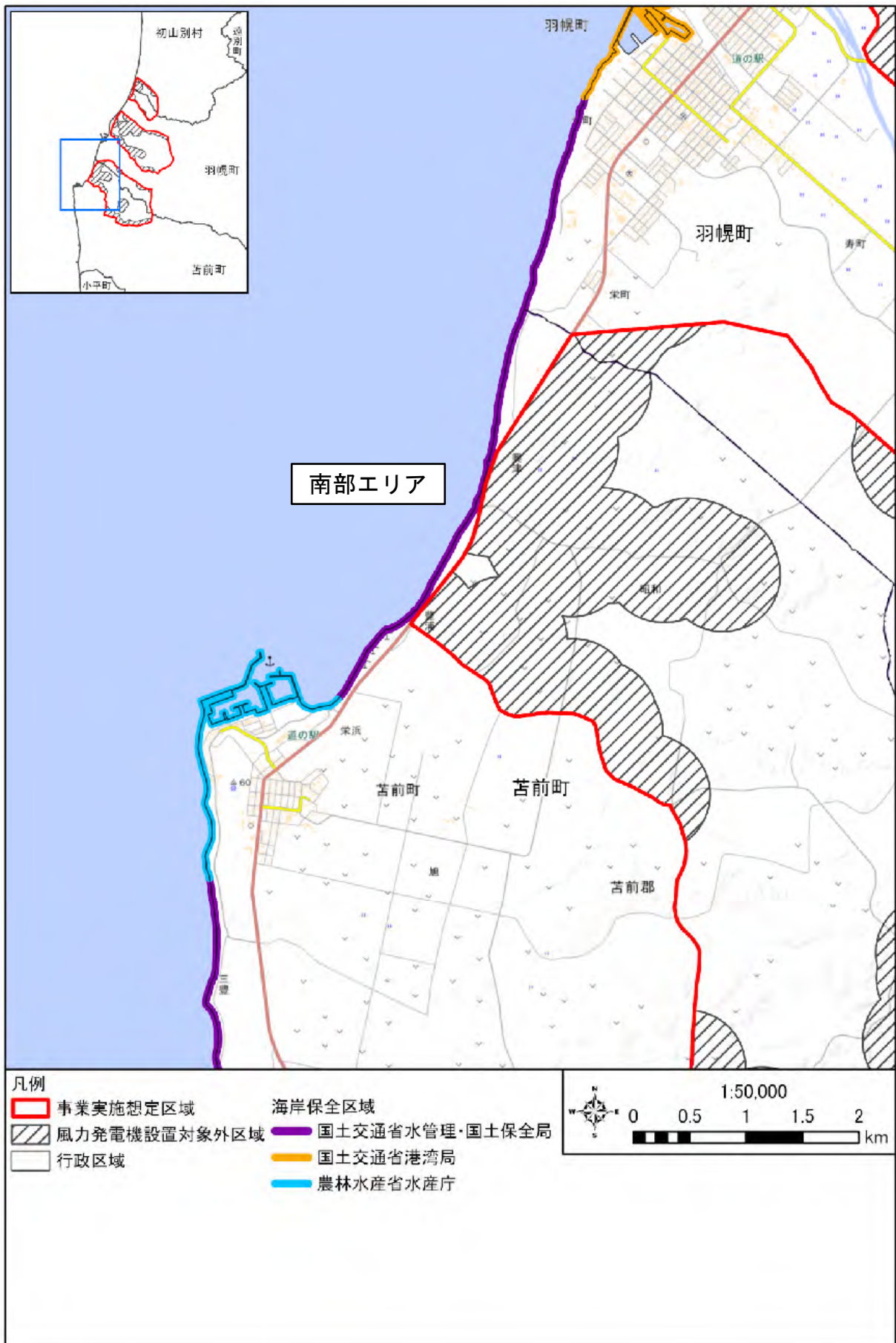
図 海岸保全区域の分布状況(詳細)(1/4)