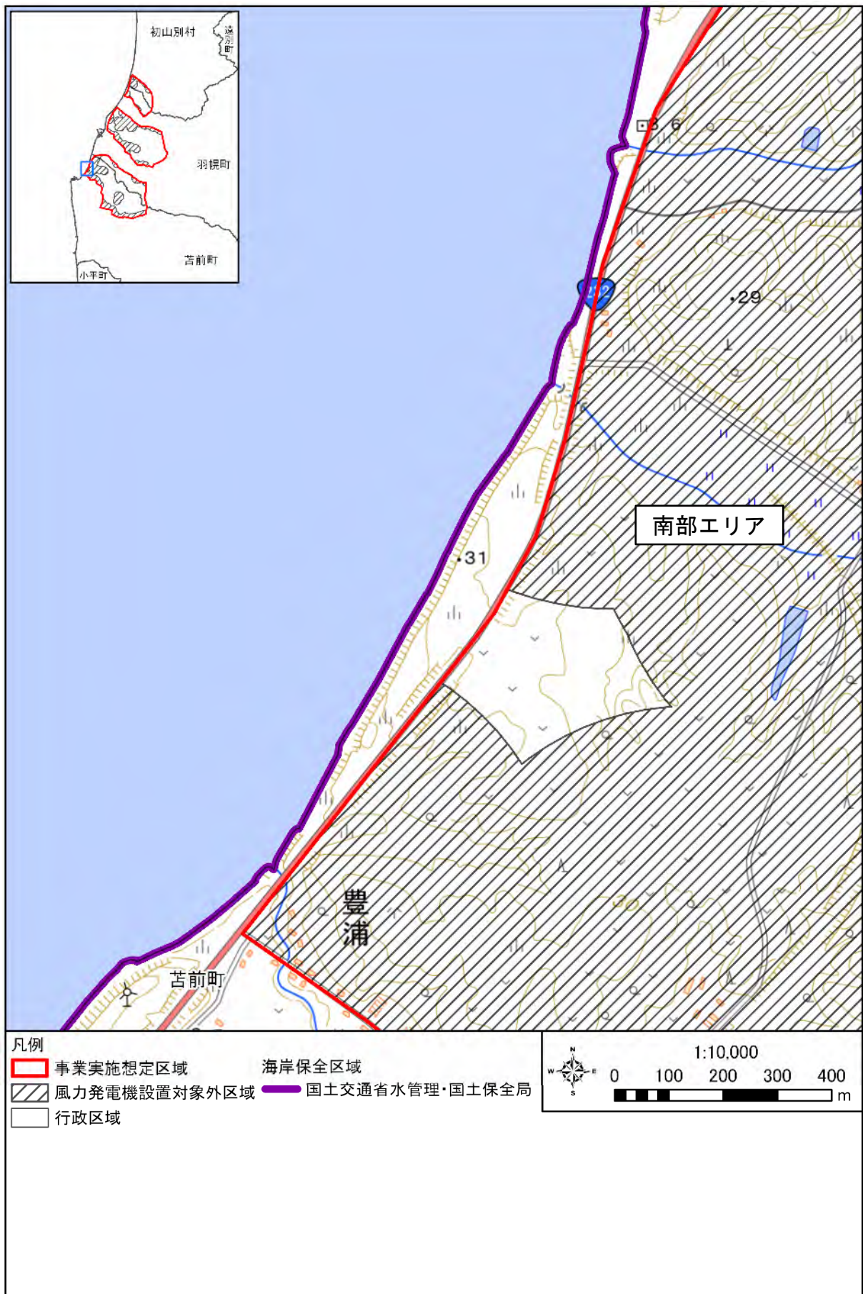
図 海岸保全区域の分布状況(詳細)(2/4)