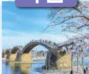
錦帯橋 / 最寄: 岩国錦帯橋空港