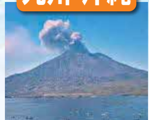
桜島 / 最寄: 鹿児島空港