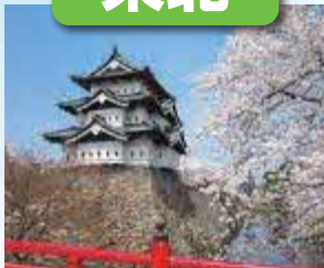
弘前城 / 最寄: 青森空港