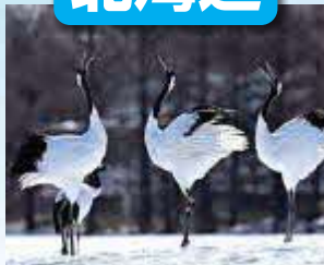
釧路湿原 / 最寄: たんちょう釧路空港