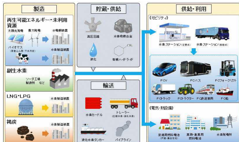
【2040 年度頃のサプライチェーンのイメージ】