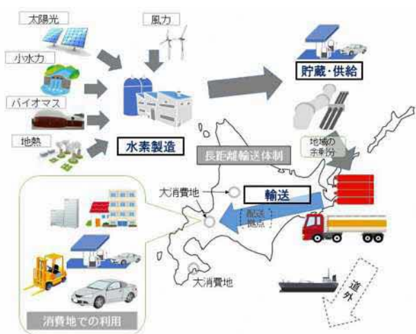
【サプライチェーン広域展開イメージ】