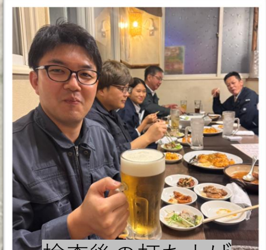
検査後の打ち上げ

職場では上司や先輩方にも話しかけやすい環境ですので、日々楽しく過ごしております。