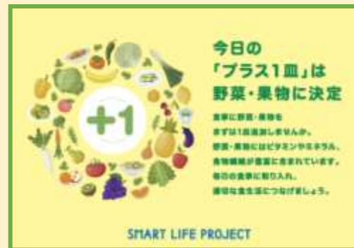
上図:厚生労働省健康日本21アクション支援システム スマートライフプロジェクト 啓発ツールより

味覚や、心を落ち着かせてくれる香りや、みずみずしい食感等、季節感を感じられます。