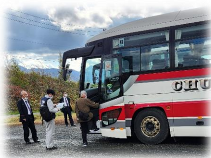
住民避難等訓練 （バスによる避難）