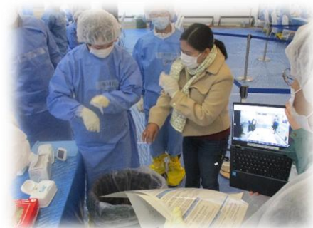
原子力災害医療活動訓練 （避難退域時検査）