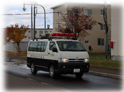
広報訓練 （広報車による広報）