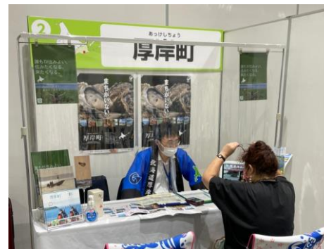
▲移住フェア出展時の様子