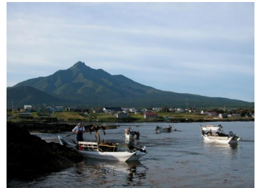
夏は朝早くから漁へ出ます