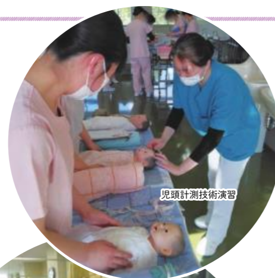
児頭計測技術演習