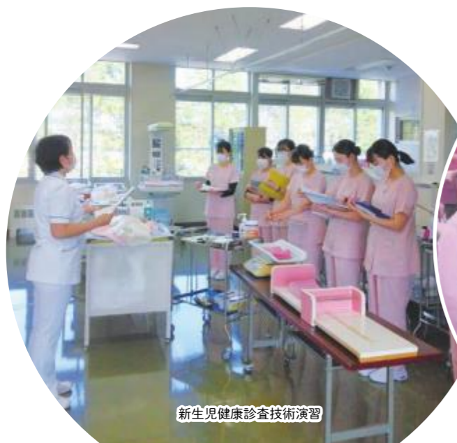
新生児健康診査技術演習