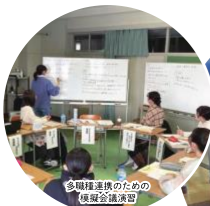
多職種連携のための 模擬会議演習