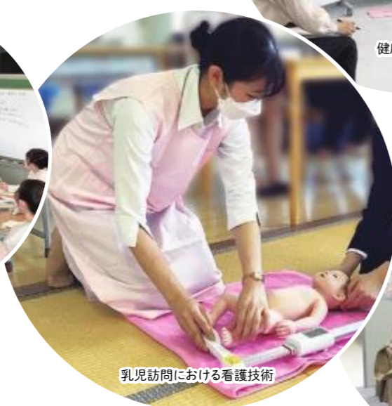
乳児訪問における看護技術