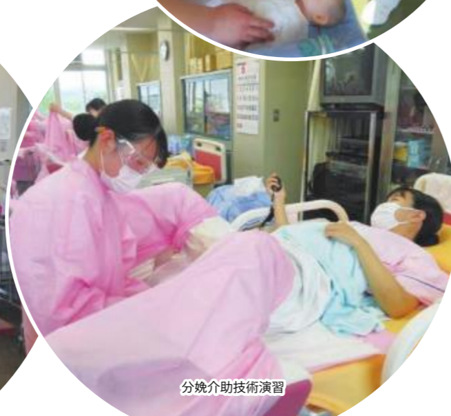
分娩助産技術演習