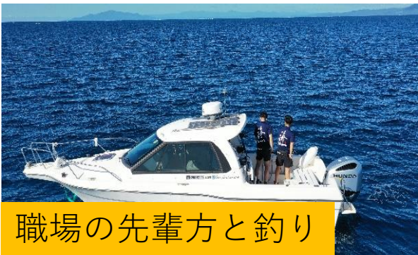
職場の先輩方と釣り