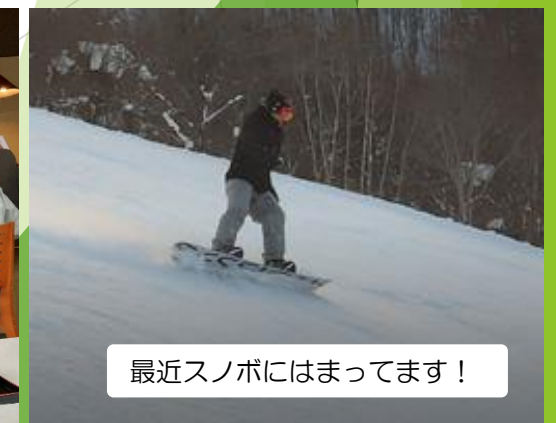
最近スノボにはまっています！