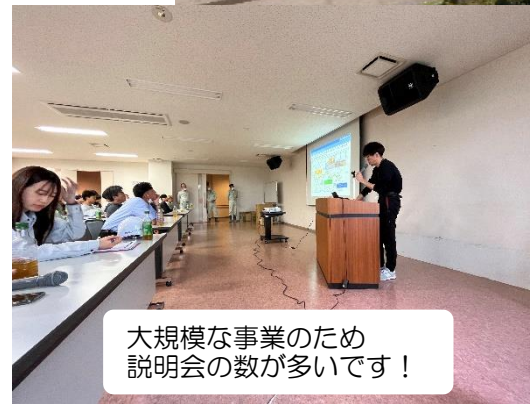
大規模な事業のため説明会の数が多いです！