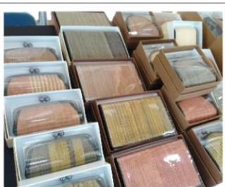
二風谷アットゥシの小物類