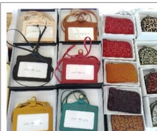
アイヌ文様入りの商品