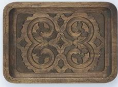
「二風谷イタ」 浅く平たい形状の 木製の盆

「伝統的工芸品産業の振興に関する法律」に基づく伝統的工芸品として国の指定を受けた平取町の工芸品「二風谷イタ」と「二風谷アットゥシ」を多くの方に知っていただくための展示・即売会を開催します。