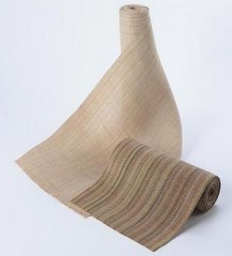
「二風谷アットゥシ」 オヒョウ等の樹皮の内皮 からつくった糸を用いて 機織りされた反物