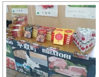
トマトジュースやカレーなど 平取町特産品

主 催 : 二風谷民芸組合、北海道 (お問合せ先: 北海道経済部産業振興課成長産業係 / TEL: 011-206-6756)