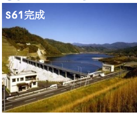
あいべつ ⑥愛別ダム(愛別町)