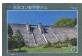
日水コン 新中野ダム