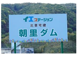
イエステーション 北章宅建 朝里ダム