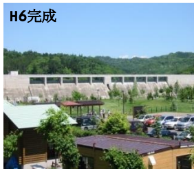
くりやま ①栗山ダム(栗山町)