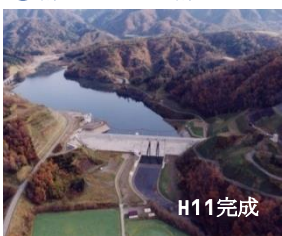
うらかわ ⑤浦河ダム(浦河町)