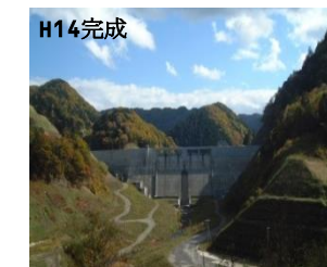
かみのくに ③上ノ国ダム(上ノ国町)