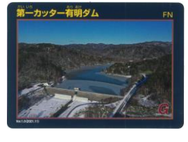
第一カッター 有明ダム