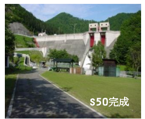
さまに ④様似ダム(様似町)