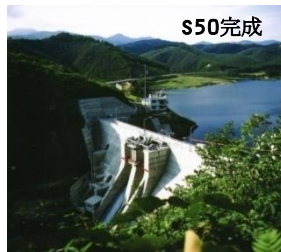
やべつ ②矢別ダム(函館市)