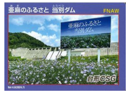
亜麻のふるさと 当別ダム