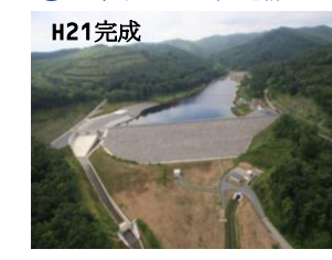
にしおか ⑦西岡ダム(剣淵町)