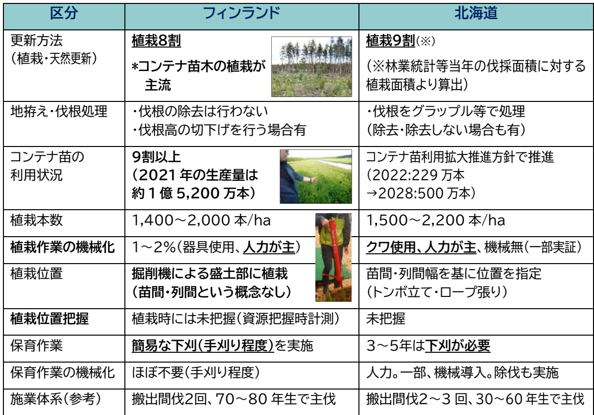
表-4 道内での造林分野での機械化等を進める上で必要な対応