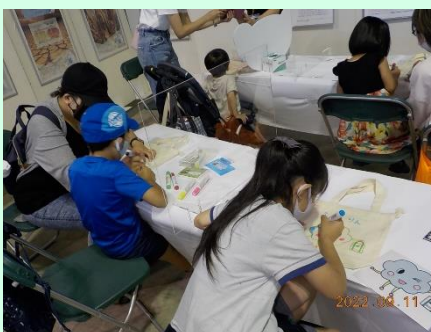
▲十勝の環境マスコット「ふわリン」を描いてくれています。