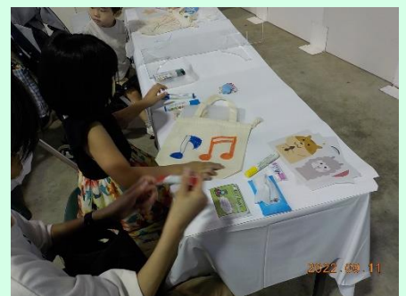
▲かわいい音符柄のマイバッグができました♪