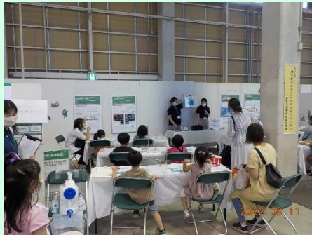
▲マイバッグ作りを始める前に、マイバッグを使う大切さについて説明しました。