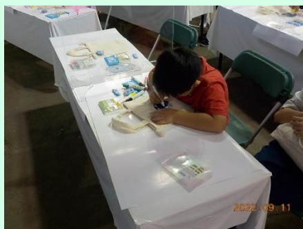
▲「自然を大事にしないと!」と、バッグに地球を描いてくれました。