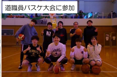
道職員バスケット大会に参加