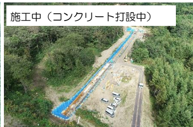
施工中（コンクリート打設中）