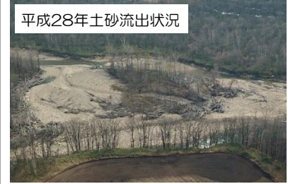
平成28年土砂流出状況