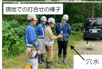
現地での打合せの様子