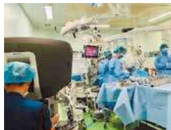
手術支援ロボット「ダヴィンチXi」 手術数は全道有数