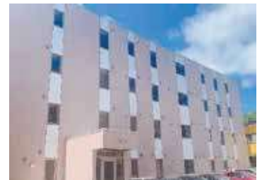
研修医宿舎(病院に隣接)