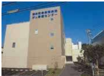
全道的にも先進的な「がん診療センター」