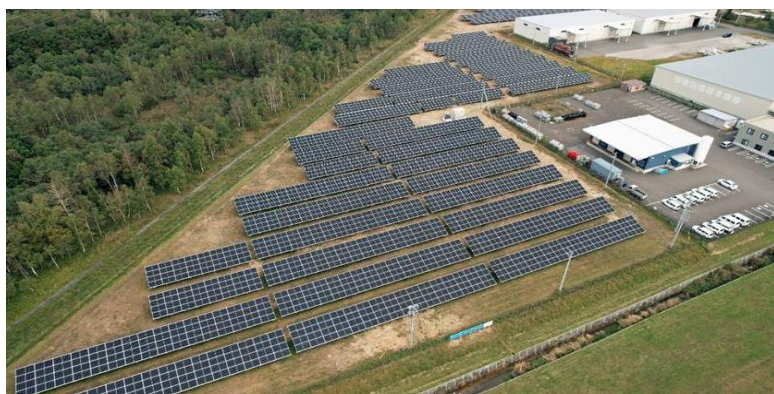
自家消費型メガソーラー（全体）