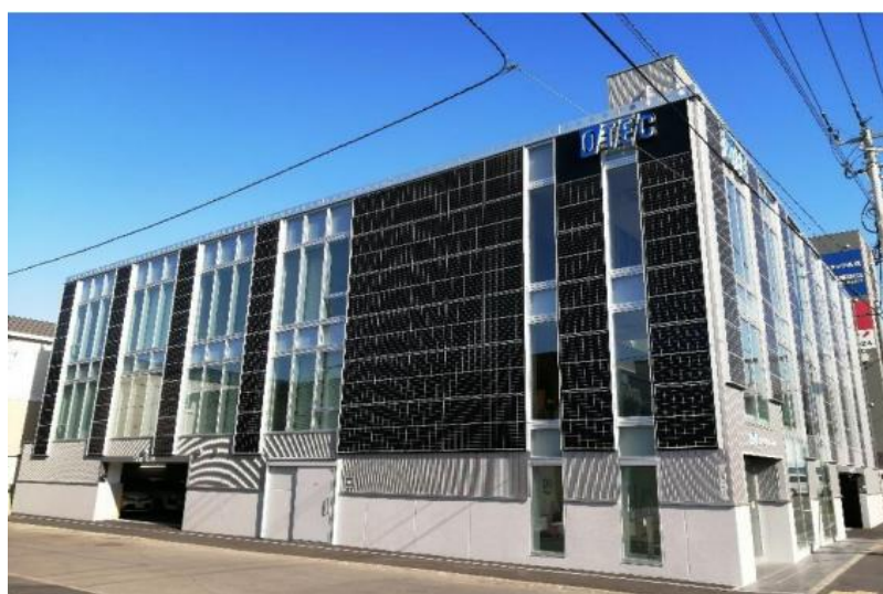
▲ Low-E複層ガラスの開口と壁面ソーラを交互に配した外観デザイン