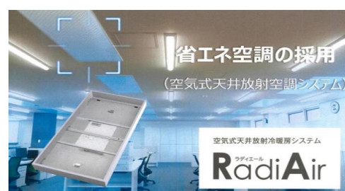
▲ 当社グループの技術である放射パネル空調