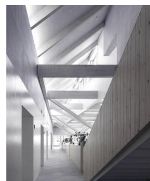
▲ ハイサイドライトや窓からの光を引き込む空間