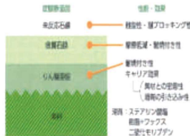
【塑性加工用表面処理】

リン酸塩皮膜処理後、石鹼系潤滑剤と反応させ、中間層に金属石鹼を生成させる事により、優れた摩擦係数、耐熱性、潤滑性を発揮