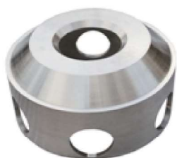
【遠心分離機用部品】

鑄造法を活かした複雑立体形状の造形を得意としており、製造の能力約1t/個の製品を特殊鋼にて製造しています。また、古くて手元に図面のない製品でも、スケッチを行い図面を起こし、製品の再生・製作を可能にします。