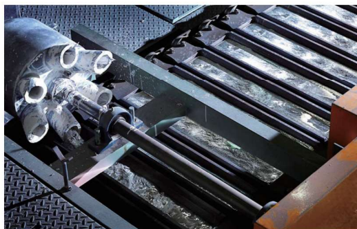
【アルミインゴット製造過程】