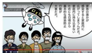
<アニメによる感染体験談>

ページへのアクセス数 第Ⅰ期:約 1,158万件 第Ⅱ期:約 798万件 第Ⅲ期:約 965万件