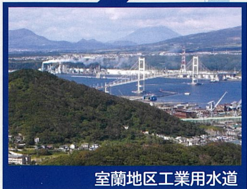
室蘭地区工業用水道

北海道企業局の工業用水道事業は、昭和42年に室蘭地区工業用水道が給水を開始して以来、昭和45年に苫小牧地区工業用水道、平成11年に石狩湾新港地域工業用水道が給水を開始し、3地区で327,000m 3 /日の給水能力をもって営業しています。