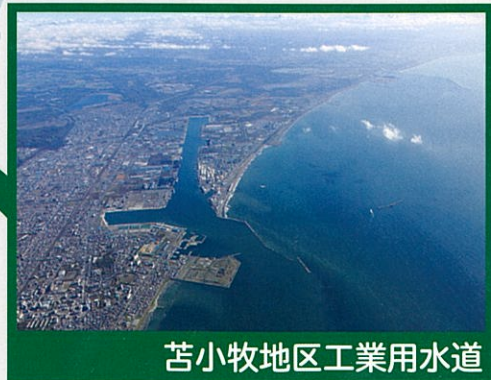
苫小牧地区工業用水道