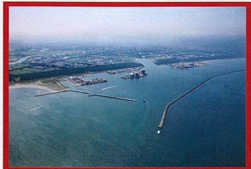
石狩湾新港地域工業用水道