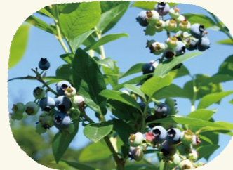
▲ブルーベリーの収穫体験は例年7月中旬～8月中旬に実施されています。