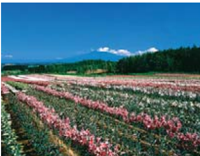
백합 (고시미즈 리리파크) 7월중순 - 9월초순