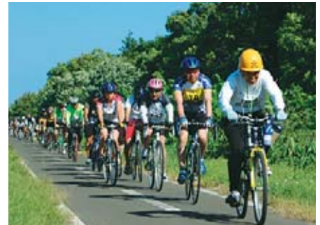
인터내셔널 오호츠크 사이클링

오무에서 샤리까지 약 212km를 2일간에 달리는 자전거 경기입니다. 시간은 상관없이 아름다운 풍경과 참가자 교류를 즐기며 골을 목표로 하는 것이 제일 중요합니다. 시원한 바람을 맞으며 오호츠크 해, 사로마 호, 노토로 호, 아바시리 호의 아름다운 풍경을 즐길 수 있습니다.