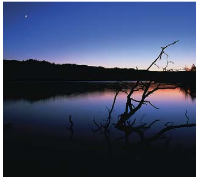
치미켓푸 호의 저녁놀이