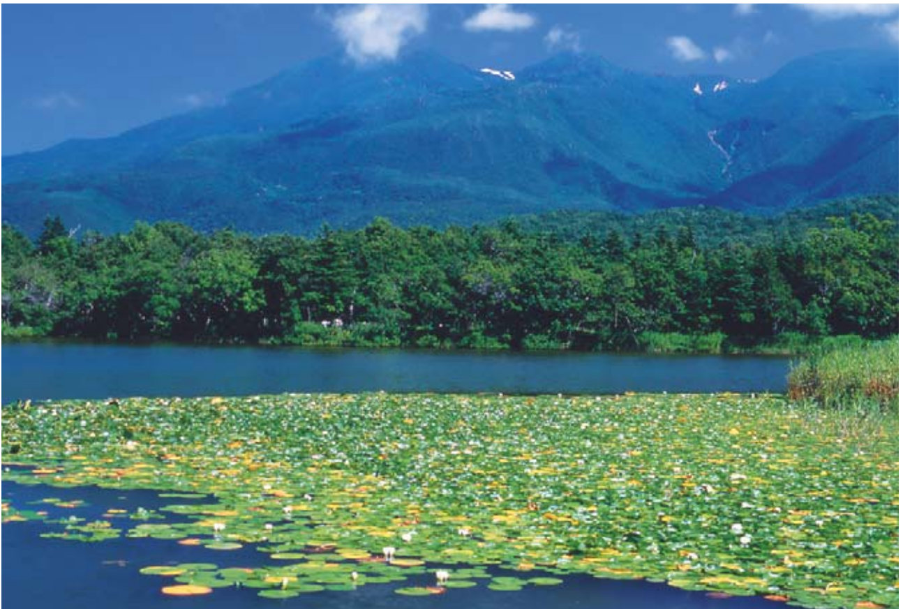
연꽃과 시레토코 五湖

한겨울(1월부터 3월)에 얼음 덩어리<유빙:流氷>가 오호츠크 해에 다가오는데 이 지역은 그 유빙을 볼 수 있는 제일 남쪽 끝이라는 점도 여기의 특색이라고 할 수 있습니다. 산업으로서는 수산업이 홋카이도 전 지역에 비하여 제일 많은 어획량을 자랑합니다. 또 농업이나 삼림 면적으로 보아도 일본 중에서 높은 수준이고 그 자원으로 매력적인 특산품을 생산하고 있습니다.