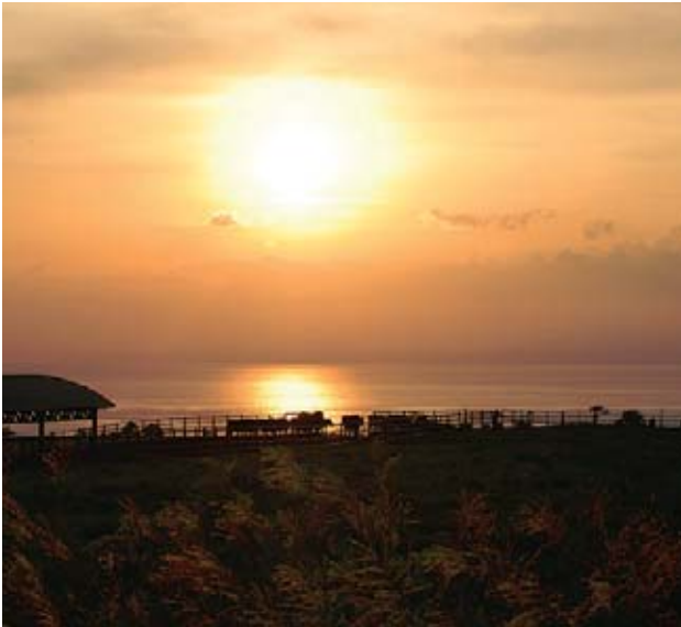
노토로 곳의 아침