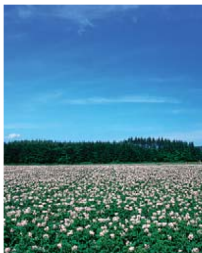
감자 꽃 7월중순