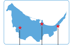
온네유 온천 (기타미) 아바시리 코한 온천 (아바시리) 시레토코 우도로 온천 (샤리)