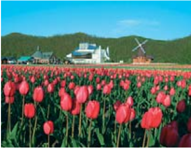
튤립 (튤립 공원) 5월중순 - 하순