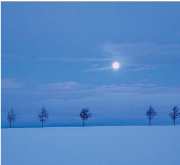
겨울 메르헨의 언덕