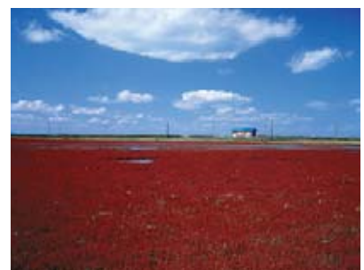
통통마디 9월중순 - 하순