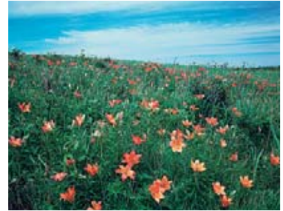
날개하늘나리 (이쿠시나 원생화원) 6월하순 - 7월중순