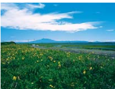
원생 꽃 (고시미즈원생화원) 6월하순 - 7월중순