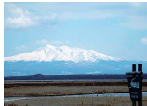
도후쓰 호에서 샤리 산을 바라봄.

또 이 호수에는 재첩, 굴등 어류와 조개류도 살고 있고 곤충류는 일본 중에서 여기서만 찾을 수 있는 희소 생물도 살고 있습니다. 그 외에는 기러기, 오리, 백조같은 철새들이 날아오고 흰꼬리수리와 참수리도 여기서 겨울을 납니다.