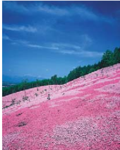
지면패랭이꽃 (다키노우에 공원) 5월중순 - 7월초순