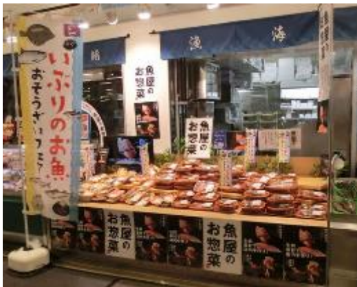
いぶりのお魚 おそうざいフェアの様子

胆振管内の食産業の発展、販売拡大を図るため、各種フェアや商談会に参加し、地域住民や道内外に幅広く「胆振の食」を発信する取組を行います。