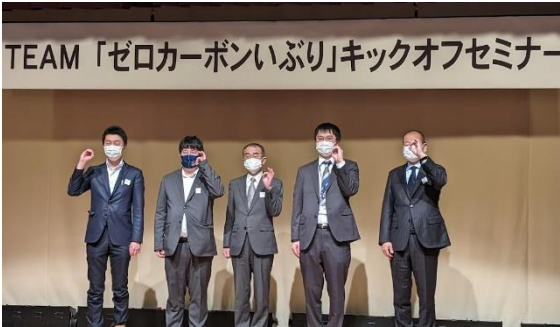
キックオフセミナーの様子

「カーボンニュートラル」に向けた各団体の省エネ・新エネ導入等の事例を共有して、産官学連携による一層の取組の加速化を図るため、TEAM「ゼロカーボンいぶり」を結成し、キックオフセミナーの開催を通じて、「カーボンニュートラル」に対する更なる理解促進と機運醸成を図ります。