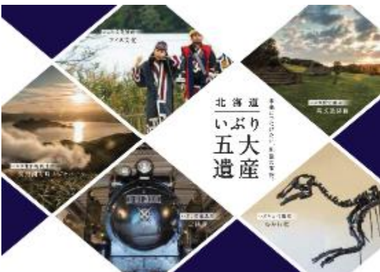
いぶり五大遺産パンフレット