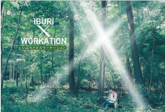
いぶりクロスワーケーションPR冊子