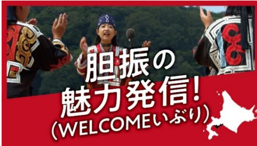
胆振の魅力発信動画（サムネイル）

ウポポイやジオパーク、縄文遺跡群をはじめとする「いぶり五大遺産」などの地域資源を教育素材として活用しながら、道外からの教育旅行誘致や観光素材の商品化を促進することで、関係人口・交流人口の増加を図ります。