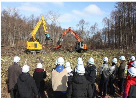
林業体験バスツアーの様子