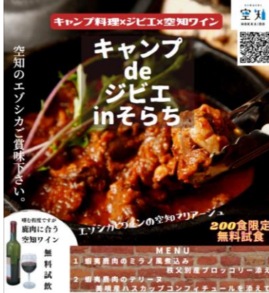
イベント開催のチラシ