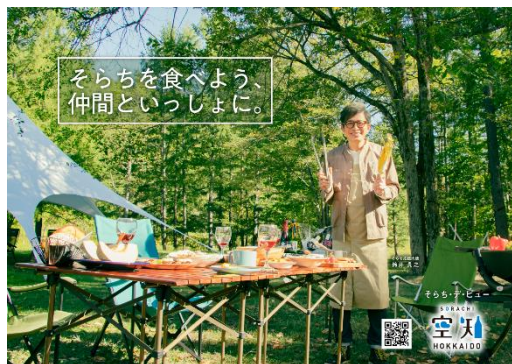
空知プロモーション動画（Youtubeで公開中）

「空知」の地域の活性化と知名度向上を目的に、平成28年に設立した管内24市町と空知総合振興局が連携する「北海道空知地域創生協議会」の活動として、主に首都圏及び札幌圏向けに、ウェブサイト「そらち・デビュー」やSNSによる情報発信を行うとともに、ターゲットを明確にした戦略的なプロモーションを展開し、新たな空知ファンの獲得に向けた取組を進めています。