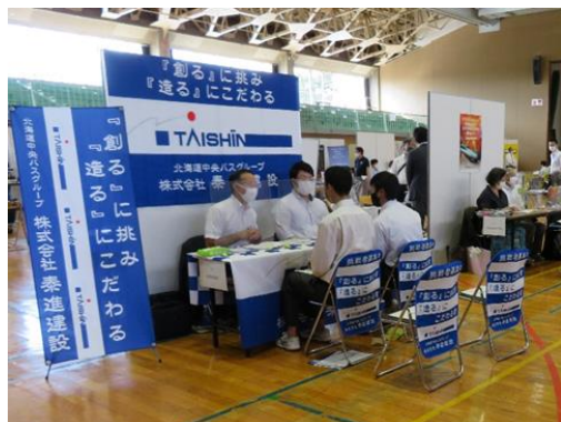
合同企業説明会の様子

人手不足が続く地元企業の認知度や理解促進を高め、空知の経済力を維持し活性化を図るため、高校生や就職指導教員、保護者を対象とした選考開始前の合同企業説明会や、専任の採用担当者を置くことが困難な中小・小規模事業者に対して採用ノウハウを提供するセミナーの開催を通して、新規学卒者の地元就職及び定着率の向上を図っています。