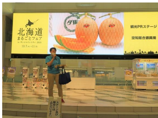
首都圏での観光プロモーションの様子

また、サイクルツーリズムに関する情報サイトの内容を充実させ、周知するほか、カフェやファームレストランを紹介するパンフレットを作成し、掲載店舗を巡る周遊キャンペーンを実施する等マイクロツーリズムの推進に向けた魅力ある観光地づくりの取組を進めています。