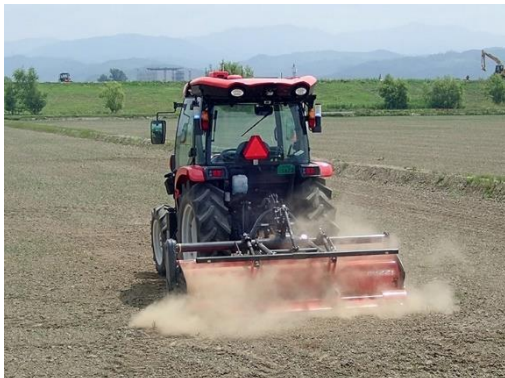
地域で活躍するスマート農業機械（ロボットトラクター）

ICTを利用したスマート農業の推進活動や次世代の食育リーダーとなり得る高校生が行う食育活動への支援、次代の農業経営を担う後継者や新規参入者に対する研修会の開催、空知の「米」や「花」の魅力発信を目的としたイベントの開催等を実施します。