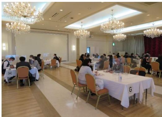
個別相談会の様子

また、空知産ワインの産地基盤づくりを推進するため、生産振興や人材育成などワイン生産者への支援を行うとともに、ワインと空知の食・観光との連携を強め空知全体の魅力を高めることで、地域の活性化につなげます。