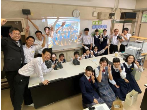
鹿児島清水中学校と美唄中学校との現地交流の様子

関係市町、民間団体等との広域的な連携のもと、JR北海道主催のヘルシーウォーキングとのコラボ企画や空知管内の中学生を対象とした鹿児島県との相互交流、炭鉄港ガイドの養成やポータルサイトによる情報発信など、交流人口の拡大を図るため様々な取組を展開しています。