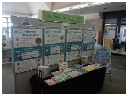
ゼロカーボンフェア（市立留萌図書館）

ゼロカーボンるもいの達成に向け、関係者間で留萌地域の目指す姿を共有し、各種取組を推進することを目的にゼロカーボン推進ネットワーク構成員を対象とした勉強会や地域住民向けの啓発活動を行い、機運の醸成を図ります。