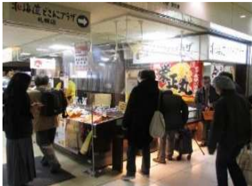
北海道るもいフェアinどさんこプラザ札幌店