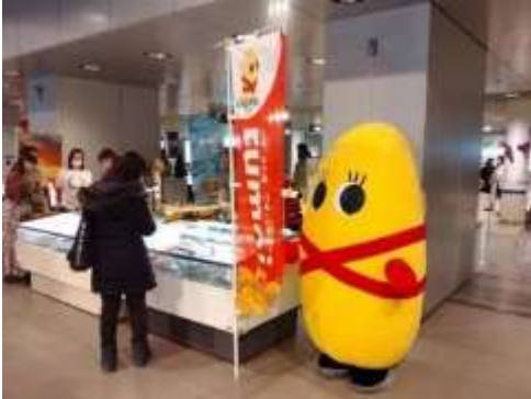
「冬のるもい大物産展！ inチ・カ・ホ」

留萌地域の食と観光のPRや、留萌地域が目的地となるためのプロモーション活動を実施し、観光客を誘引する取組を進めています。