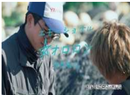
留萌地域プロモーション動画作成