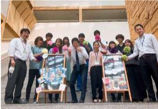
若手職員ネットワーク「RuRuメイト」

開設から約1年でフォロワー数1,000人を越え、順調にその数を更新し、知名度の低い留萌管内にとって内外を問わず多くの方に地域をPRできる魅力的なツールとなっています。