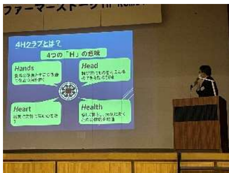
「ファーマーズトーク in RUMOI」開催状況

若い農業者や関係機関とともに連携して、地域での機運醸成を図りつつ、農作業経験の少ない多様な人材の受け入れなど、安定的な人材の確保やサポート体制の構築や、モデル地域を設けて、具体的な取組の構築、気運醸成や管外在住の農家子弟へのアプローチ（情報発信・相談の場づくり）の取組を実施します。