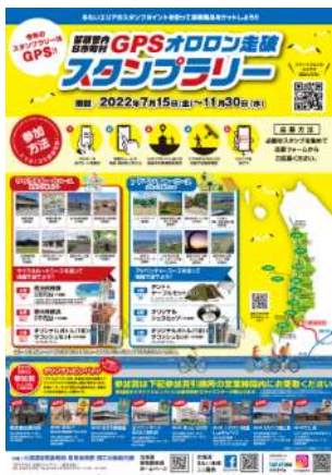
スタンプラリー 告知ポスター

深川・留萌自動車道が全線開通した効果を管内全域に普及させるため、市町村と連携して観光メニューの磨き上げや観光プロモーションを行い、誘客促進を図る取組を進めています。