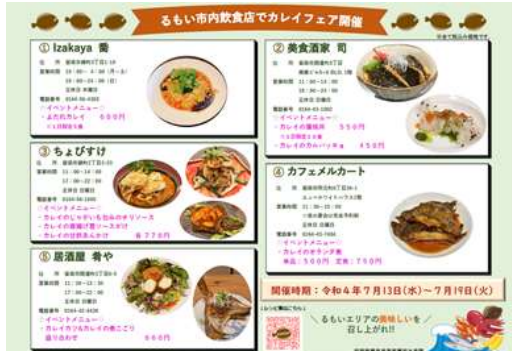
らもい市内飲食店の「カレイフェア」