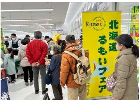
コーチャンフォー若葉台店での管内農畜産物PRイベント状況

そのため、本事業において水稻の直播栽培、輪作体系等の技術を確立し経営の安定化を図るとともに、多種多様な農畜産物の需要拡大や、実需者とのマッチングによる収益性の向上、スマート農業の推進による農作業の省力化や環境との調和を推進します。