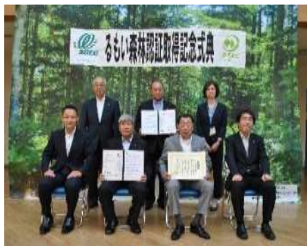
森林認証取得記念式典