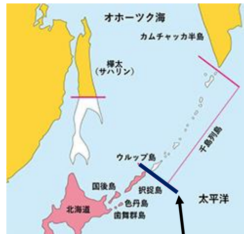
にちろつこうじょうやく もと こつきょうせん 日露通好条約に基づく国境線