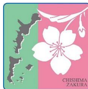
北方領土返還要求運動のシンボルの花「千島桜」