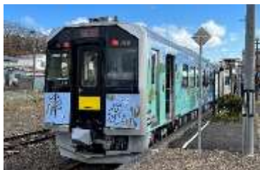
H100形ラッピング車両