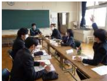
高校生と若手建設産業就業者との意見交換会(帯広市)