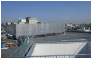
災害拠点病院自家発電施設整備 （北海道医療センター）