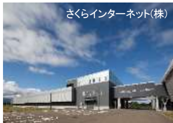
さくらインターネット(株)