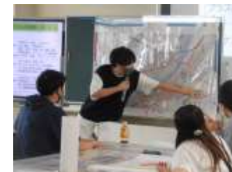
北海道地域防災マスター認定研修会（釧路市）