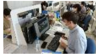
災害時外国人支援訓練

《指標》最大クラスの洪水に対応したハザードマップを作成した市町村の割合 48.9%(2018) → 100%(2024)