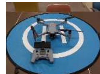
映像伝送システム（ドローン）の整備