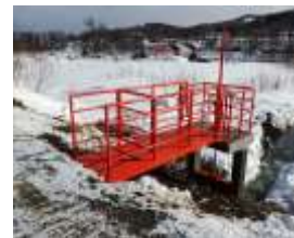
樋門の長寿命化 (仁木町)