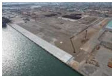
苫小牧港中央北ふ頭整備状況