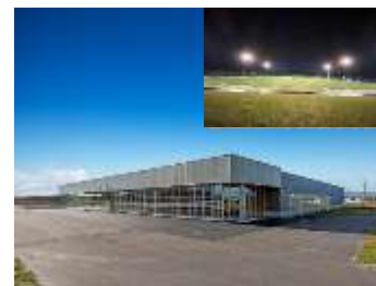
避難場所としても活用される東光スポーツ公園(旭川市)