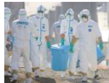
鳥インフルエンザ発生に係る自衛隊 災害派遣（千歳市）