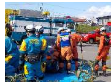
専門部隊の合同訓練 (新ひだか町)