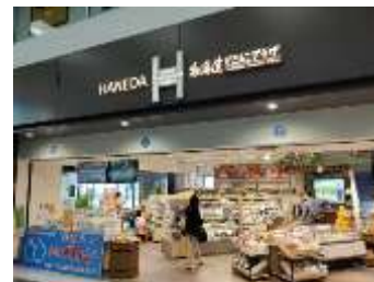
どさんこプラザ羽田空港店（東京都）