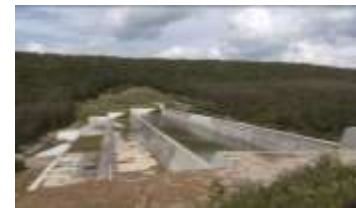
融雪型火山泥流対策(上富良野町)