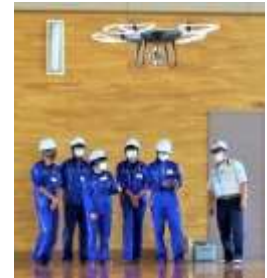
農業高校向けスマート農業実践講座（本別町）