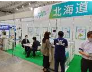
展示会出展（2022働き方改革エキスポ） （千葉県）