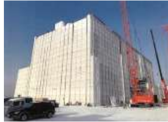
医療施設の耐震化 (旭川市)