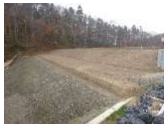
ため池の耐震対策(栗山町)