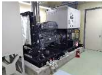
庁舎の非常用電源設備整備 (檜山振興局)