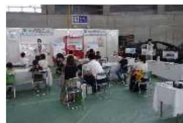
水素利用の普及啓発（札幌市）