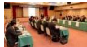
石狩川上流域減災対策協議会