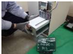
蓄電池交換（根室振興局）