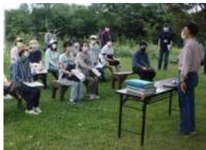
農村ツーリズム現地講座(札幌市)