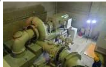
小水力発電設備の改良 (愛別ダム)