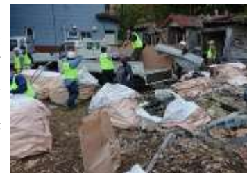
災害ボランティア活動の様子 (2018.9 厚真町)