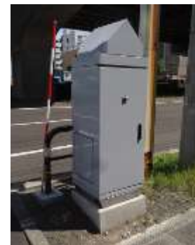
信号機電源付加装置 (札幌市)