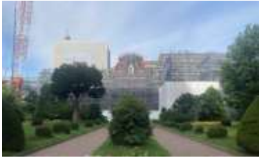
赤れんがが庁舎改修事業