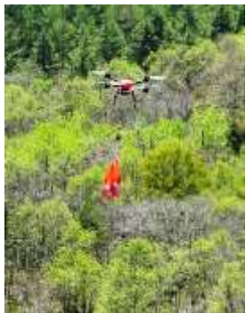
ドローンによる苗木運搬(浦幌町)