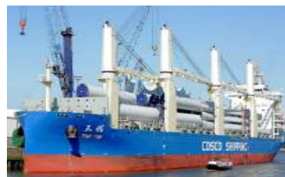
北極海航路船舶の寄港 (釧路市)