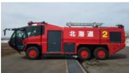
化学消防車の更新 (紋別空港)