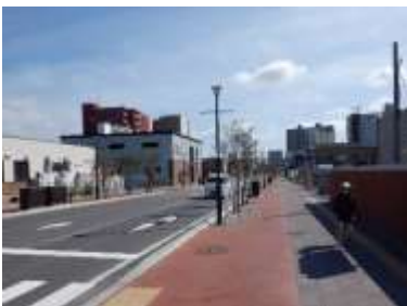
無電柱化の推進 (野幌停車場線)