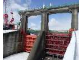
幌別ダム改修工事 (登別市)