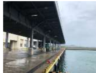
漁港整備（三石漁港）