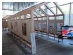
北海道消防PRパネル展（道庁1階ロビー）