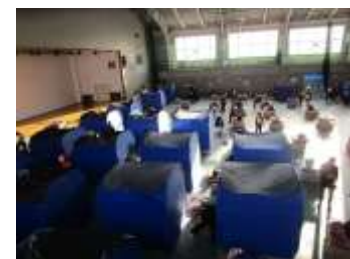
厳冬期における防災総合訓練(2022.12 滝川市)