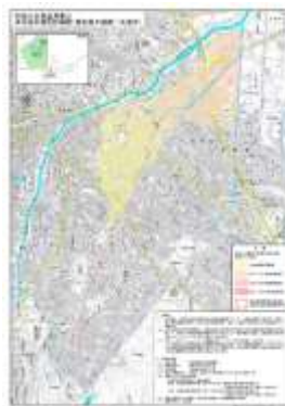
浸水想定区域図（札幌市）