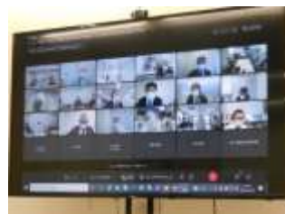
港湾BCPに基づくWeb訓練 (道内6港)