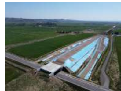
ICアクセス道路事業補助 (山花鶴丘線)