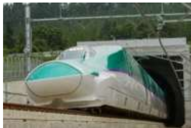
北海道新幹線 H5系