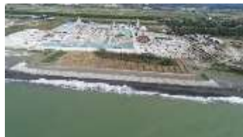
海岸防災林造成 (むかわ町)