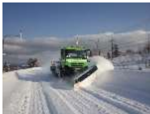
新雪除雪作業（中頓別町）