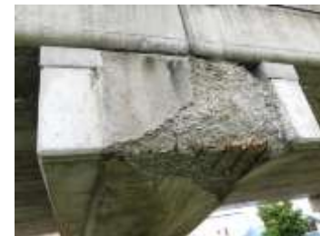
橋梁の老朽化対策箇所