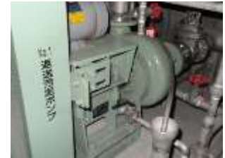
漁業集落排水処理施設の機器更新 (上ノ国町)