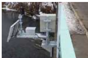
危機管理型水位計 (洪水時に特化した低コスト水位計)