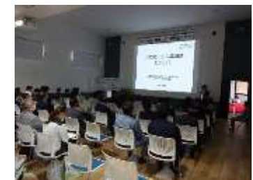
バイオマス活用セミナー（帯広市）