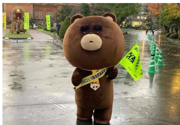
就任式後は手旗を持って啓発活動へ