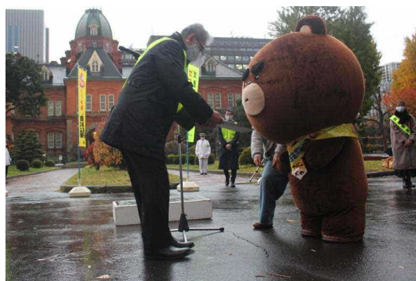
環境生活部長から依頼状を手渡し、やべーべやが飲酒運転根絶アンバサダーに就任！