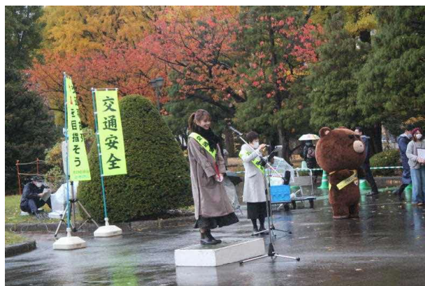
セーフティコールで就任式を開催

11月13日に開催した「冬の交通安全運動セーフティコール」で、「やべーべや」が交通安全対策七者連絡会議の「飲酒運転根絶アンバサダー」に就任しました。就任式とその後の啓発活動の様子をお伝えします。