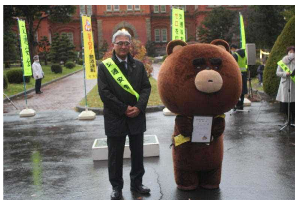
依頼状を手に記念撮影