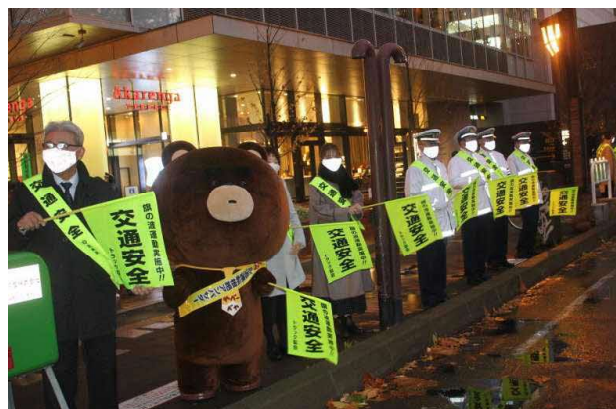
黄色い旗の波運動で街頭啓発を実施！