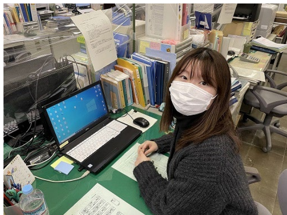
令和3年度入庁 渡島総合振興局保健環境部社会福祉課

私が社会福祉職員を目指した理由は、大学で専攻していた心理学を活かし、問題に介入し支援することで困っている方を支えたいと思ったからです。また、大学では児童発達支援事業所で実習を経験し、これまで学んだことを活かしたいという気持ちがより強くなり、社会福祉職員を目指しました。