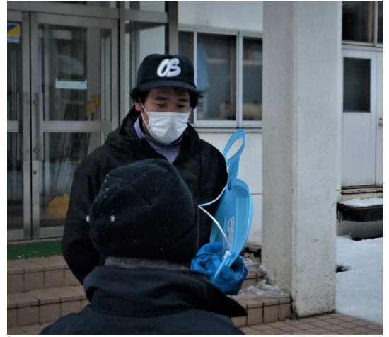
令和元年度入庁 大沼学園 自立支援課

特に児童相談所では、様々な背景から家庭での生活が困難になってしまった子どもたちとの出会いがありました。その経験が、「自分にも何か出来ることがあるかもしれない」と社会福祉の道へ進むきっかけになりました。