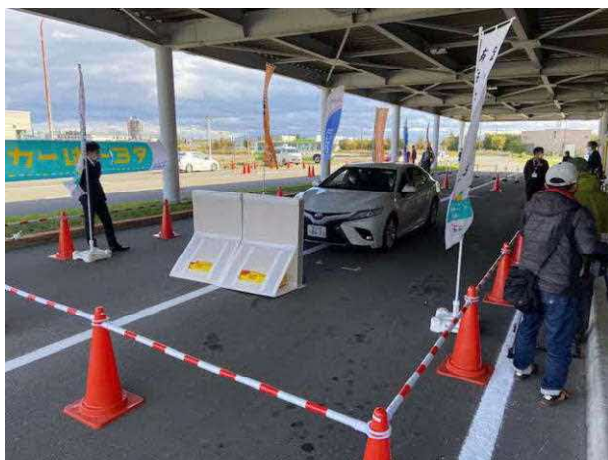
I C S（インテリジェントクリアランスソナー） 踏み間違い事故フォローシステムの体験状況