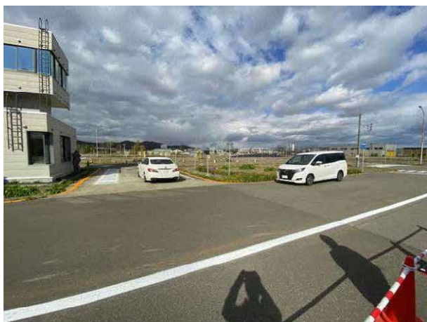
R C T A（リヤクロストラフィックアラート） 後退時の死角を検知して注意喚起するシステム の体験状況