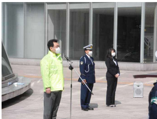
道民生活課交通安全担当課長の挨拶