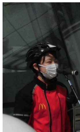
日本マクドナルド株式会社による 交通安全メッセージ