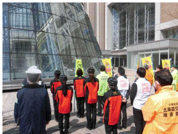
啓発開始式の様子