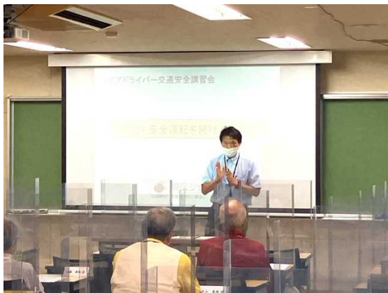
道環境生活部道民生活課交通安全担当課長の挨拶

包括連携協定を締結している「損害保険ジャパン株式会社」と共催で、7月16日、札幌運転免許試験場において、高齢運転者の安全運転意識を高め交通事故防止を目的とした、「シルバードライバー向け安全運転講習会」を開催しました。講習会では、講義やトヨタ自動車各販売店様の協力を頂き、安全運転サポート車の試乗体験を行いました。