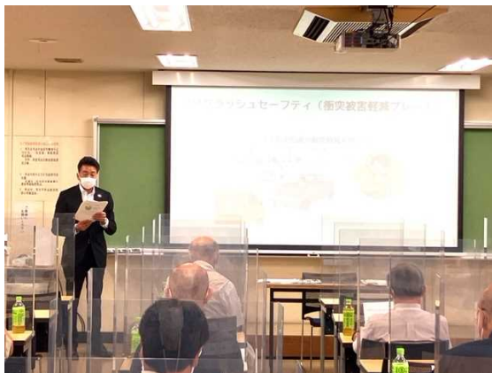
トヨタ自動車販売店担当者による安全運転サポート車の説明