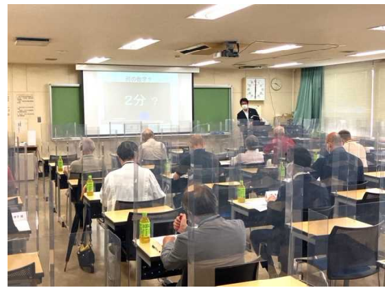
損害保険ジャパン（株）担当者による講義