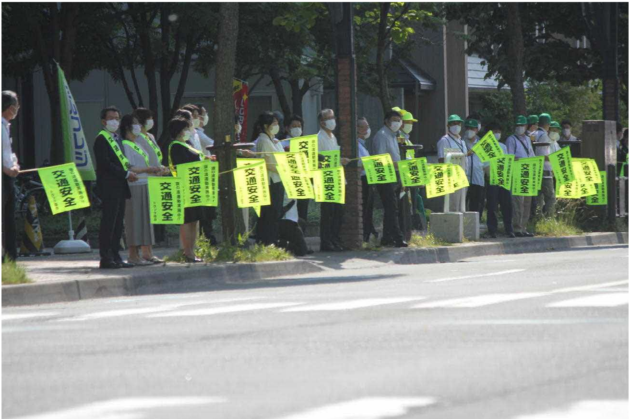
決起大会終了後、夏の交通安全「セーフティコール」旗の波を実施しました。