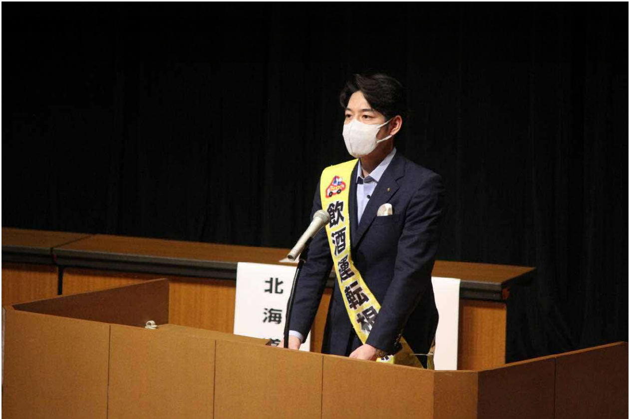
鈴木知事の主催者挨拶