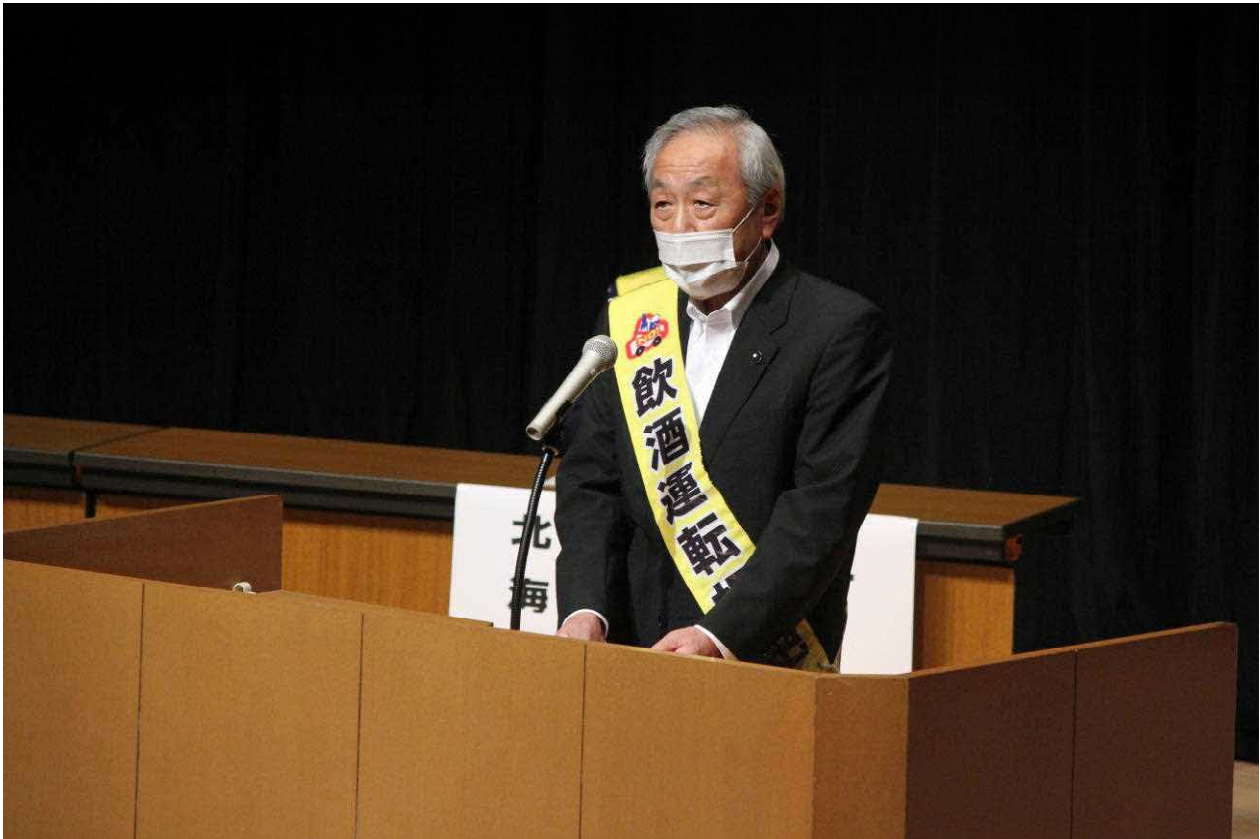
市橋北海道議会副議長の来賓挨拶