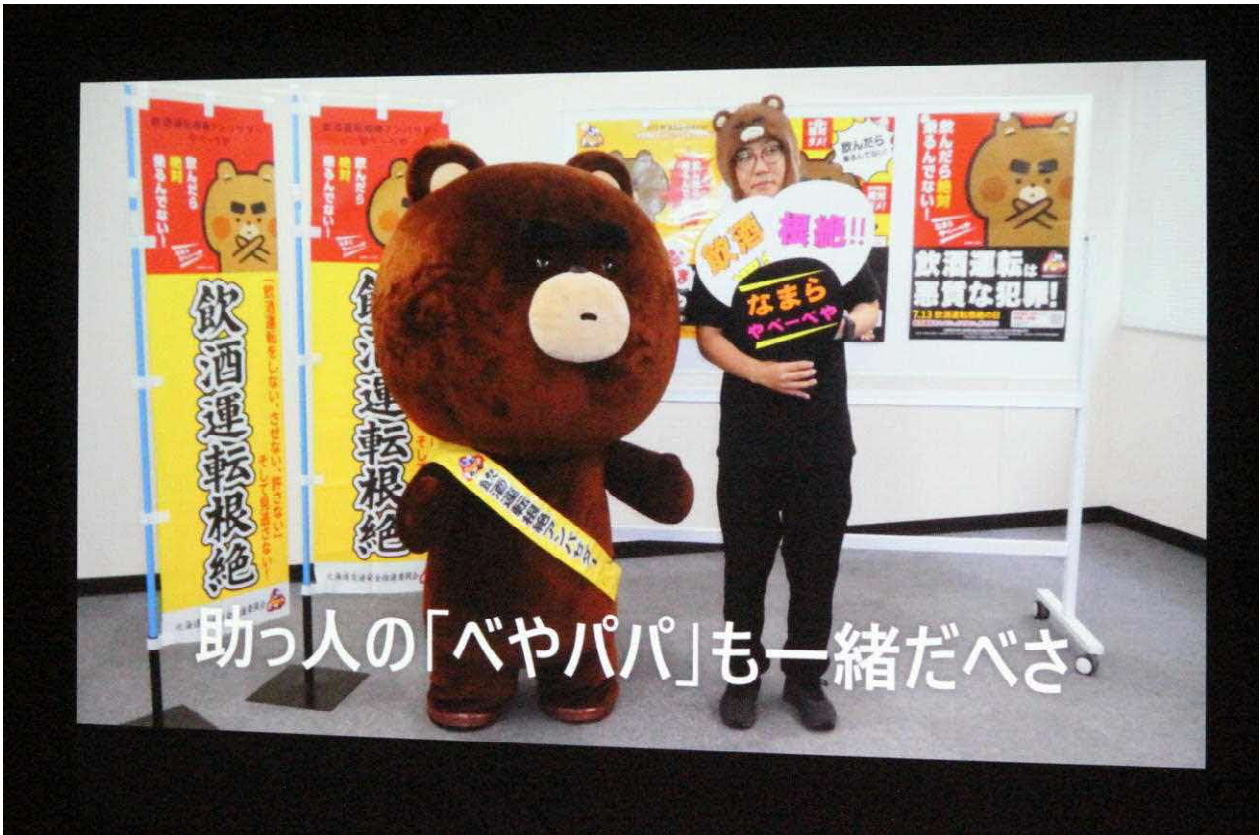
飲酒運転根絶アンバサダー「やべーべや」からのお知らせ動画