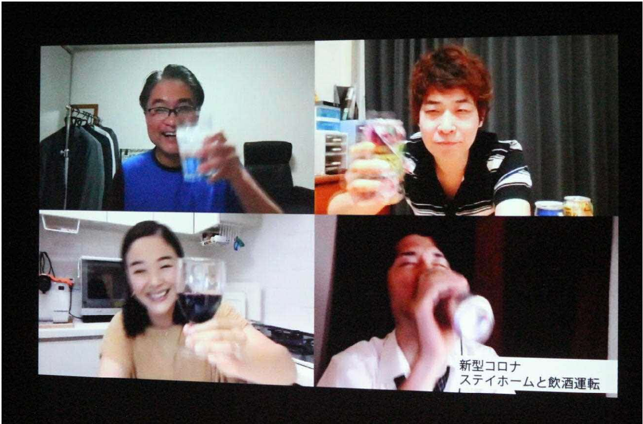
「新型コロナステイホームと飲酒運転」（特定非営利活動法人ASK作成）