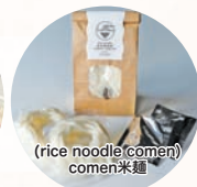
(rice noodle comen) comen米麺