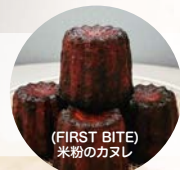
(FIRST BITE) 米粉のカヌレ