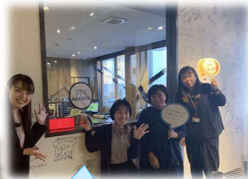
地域関係者の皆さんとラジオ出演