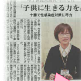
母子保健奨励賞受彰の記事