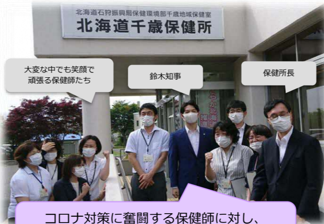
大変な中でも笑顔で頑張る保健師たち

今回、活動の一部を紹介しましたが、全道各地、地域の状況は様々です。保健師はその現状をしっかりと見極めながら、日々の活動を展開しています。そうした地道な保健活動の功績を称えられ、母子保健奨励賞や秩父宮妃記念結核予防功労賞など全国的な表彰を受けています。そんな先輩保健師がいる北海道で一緒に活動してみませんか？