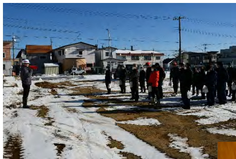
地震・津波避難訓練