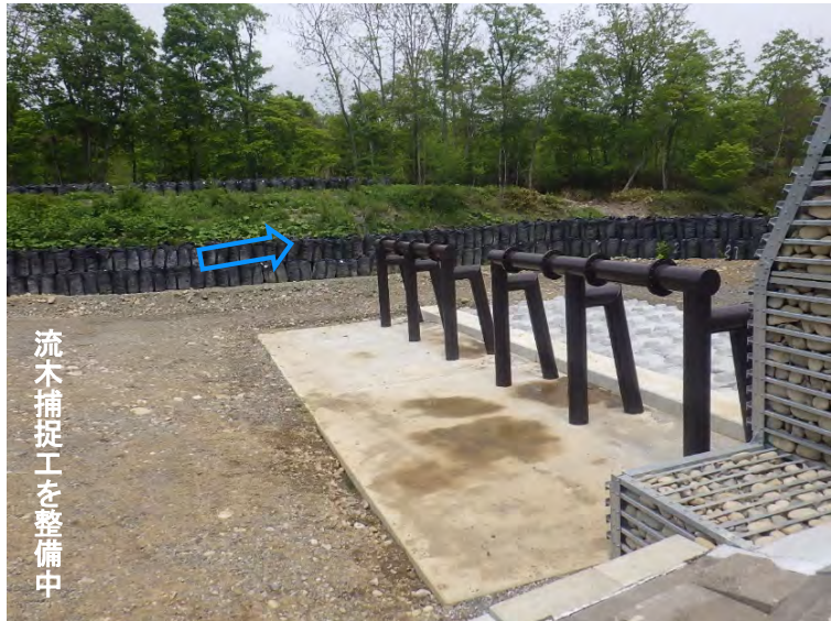
流木捕捉工を整備中