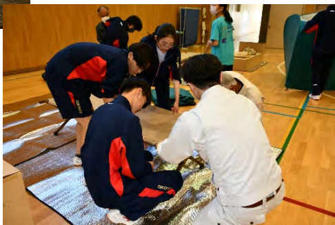
広尾高校避難所設置 運営訓練