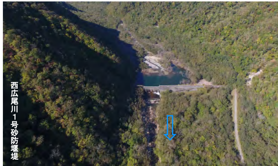
西広尾川1号砂防堰堤